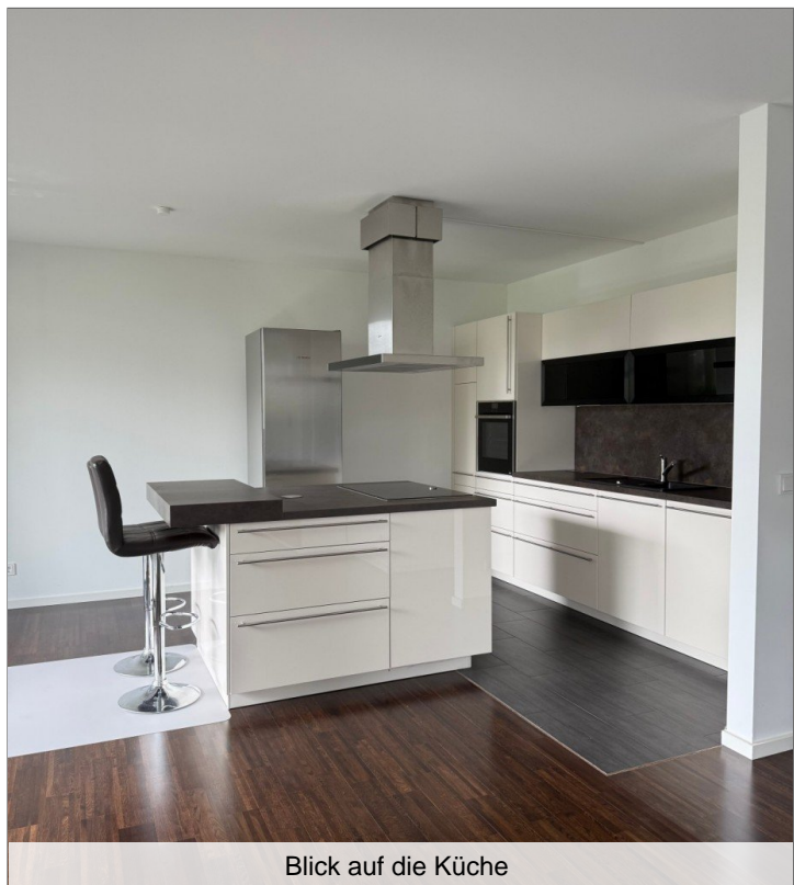
Blick auf die Küche