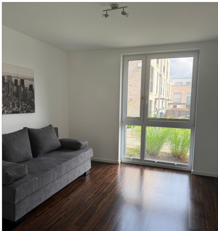
Schlaf- oder Arbeitszimmer